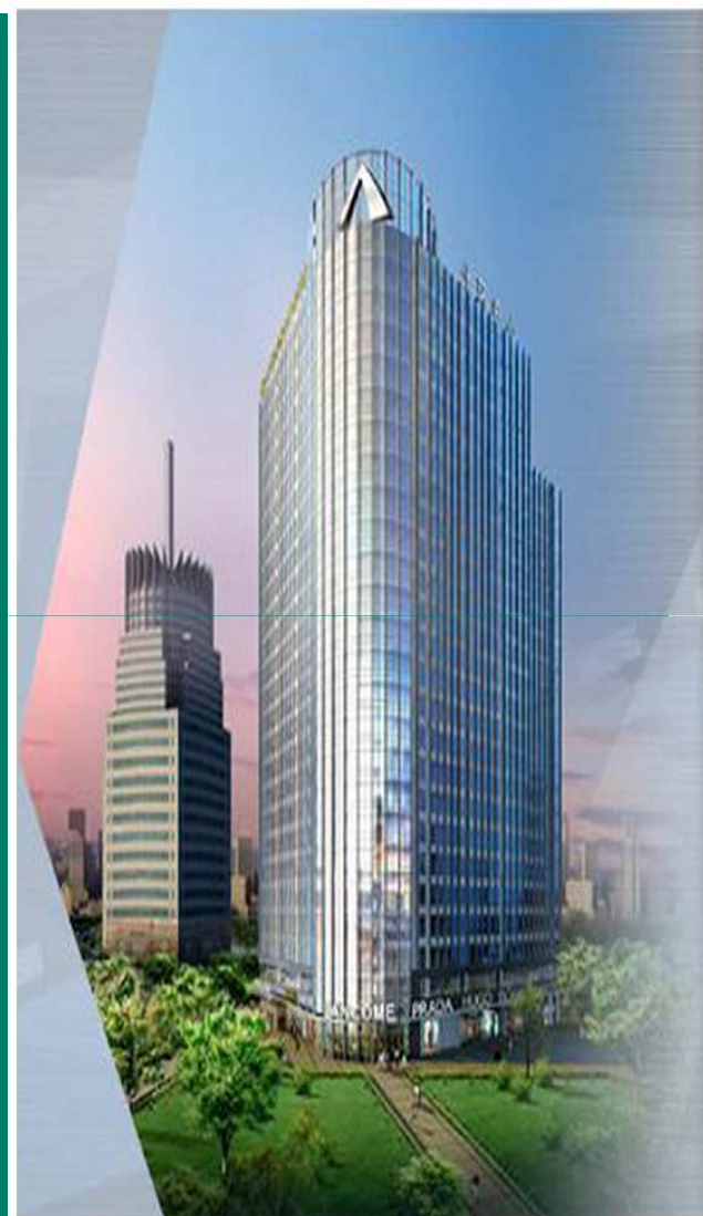
首创北环国际中心

http://www.chinacir.com.cn/jghqbg/ebhbbbh.shtml