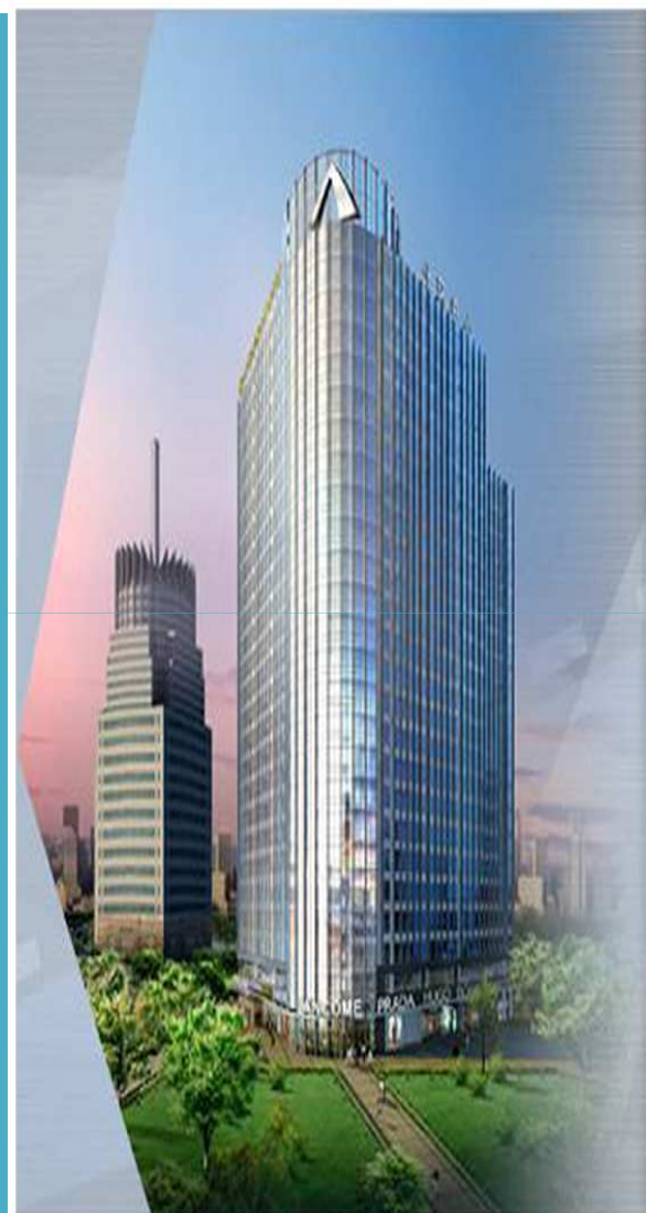
首创北环国际中心